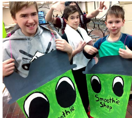
Smoothies Shop Fabrication de délicieux smoothies Bas-Saint-Laurent – Secondaire 2 e cycle