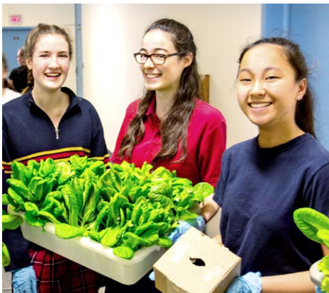
Serre-toi Projet environnemental de serre hydroponique Capitale-Nationale – Secondaire 2 e cycle