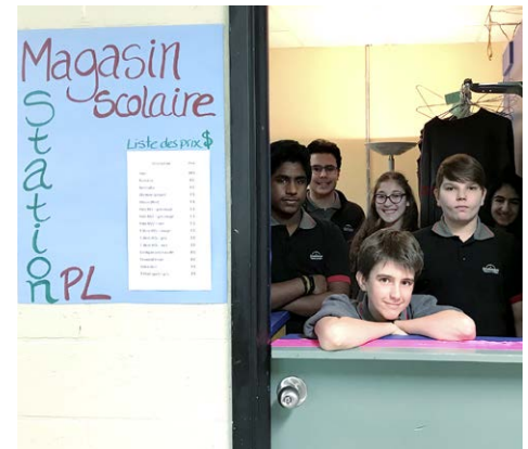
Magasin scolaire – Station PL Magasin scolaire pour une consommation responsable Montréal – Secondaire 2 e cycle