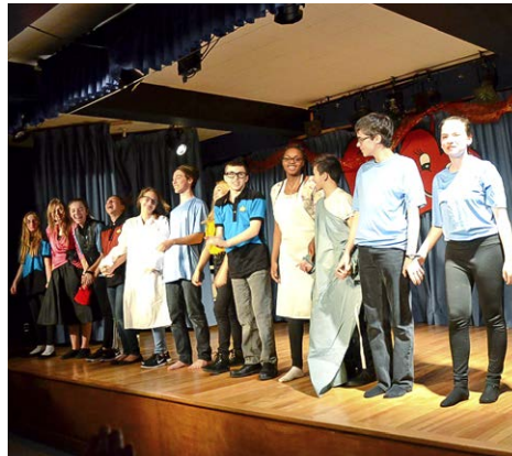
Soirée de théâtre, poésie et... chocolat Saynètes, poèmes et musique Estrie – Secondaire 1 er cycle