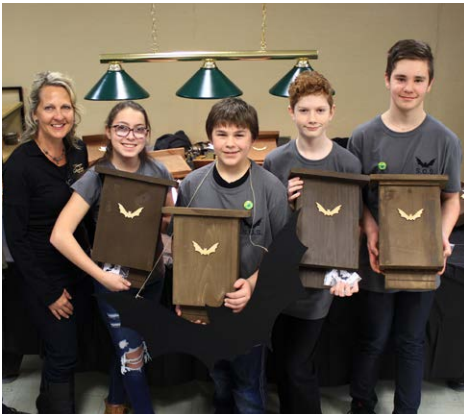
S.O.S. Chauves-souris Favoriser le peuplement des chauves-souris Mauricie – Secondaire 1 er cycle

Dans le cadre de la Semaine des entrepreneurs à l'école, tu as rencontré un entrepreneur qui t'a parlé de son parcours. Savais-tu que des jeunes de ton âge ont réalisé plein de belles initiatives? En voici quelques exemples :