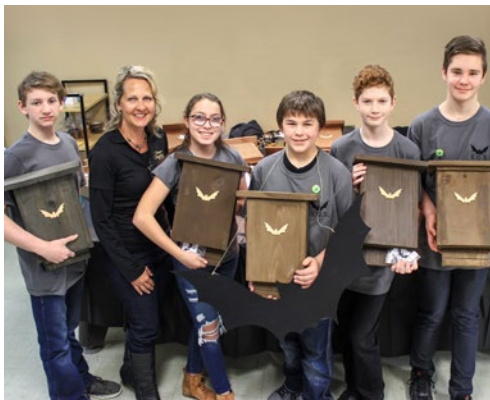
S.O.S. Chauves-souris Favoriser le peuplement des chauves-souris! Mauricie – Secondaire, 1 er cycle