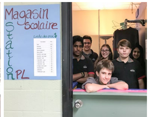
Magasin scolaire – Station PL Magasin pour une consommation responsable Montréal – Secondaire, 2 e cycle