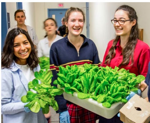
Serre-toi Projet environnemental de serre hydroponique Capitale-Nationale – Secondaire, 2 e cycle