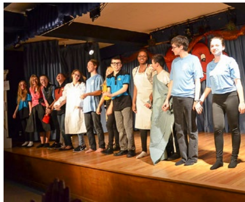
Soirée de théâtre, poésie et... chocolat Saynètes théâtres, poèmes et musique Estrie – Secondaire, 1 er cycle