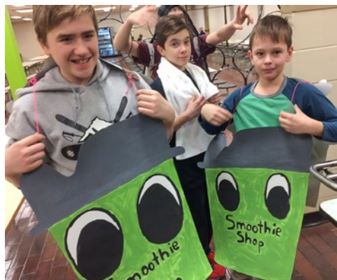
Smoothie Shop Fabrication de délicieux smoothies Bas-Saint-Laurent – Secondaire, 2 e cycle